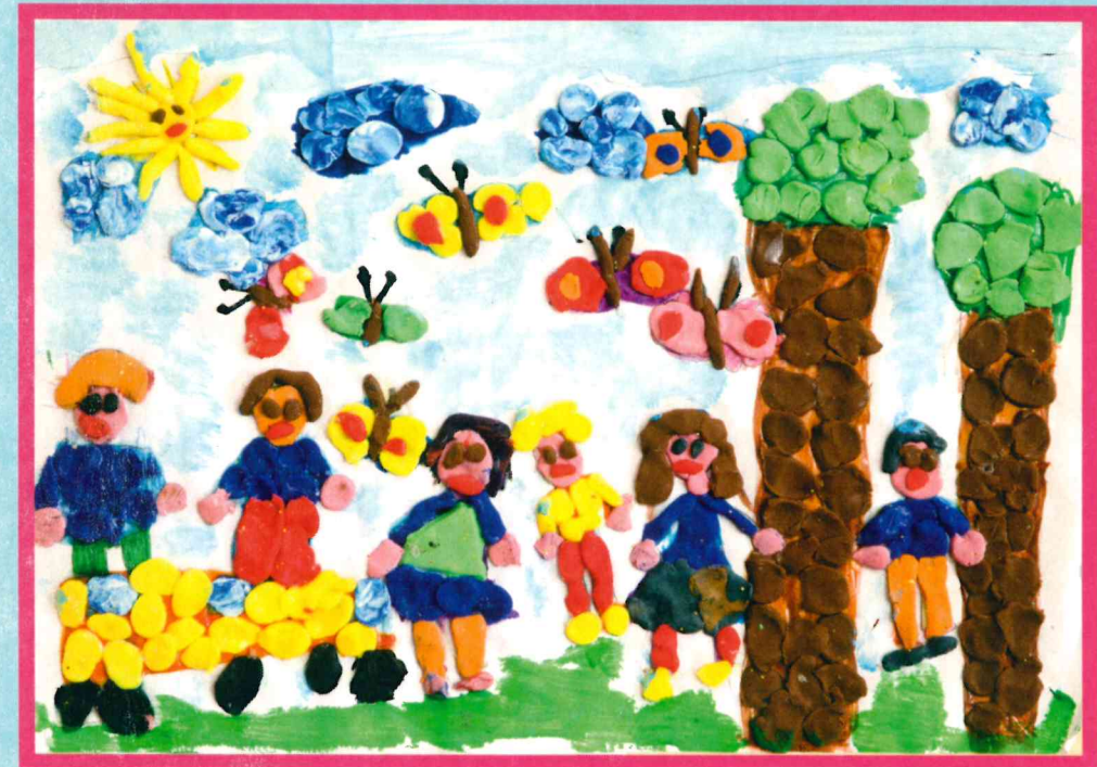
Disegno: Scuola dell'Infanzia "Ottolenghi" - Marina di Ravenna, sezione FARPALLE - Anno scolastico 2016-2017

Di ognuna sarà data dettagliata notizia attraverso i consueti canali di informazione